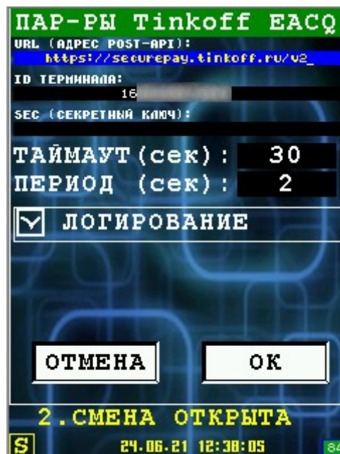
Иллюстрация 4: Диалог настройки параметров

Внимание: В поле ввода SEC не выводится текущее значение секретного ключа. Если хотите его оставить без изменения — не заполняйте это поле (оставьте пустым), если хотите ввести новый ключ — введите его в поле ввода.