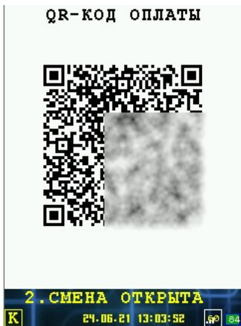
Иллюстрация 3: Диалог вывода QR кода оплаты и ожидания оплаты клиентом