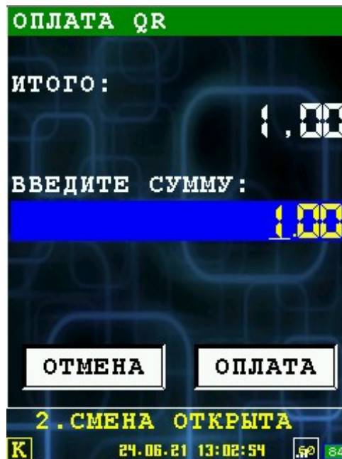
Иллюстрация 2: Ввод суммы на оплату